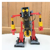
アドバンスコース 「大人も唸る完成度」