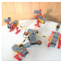
ミドルコース 「4体合作でお散歩中」