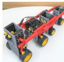
ベーシックコース 「お友達のロボと連結」