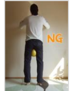
かかとが離れてはダメ！