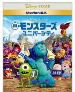
続編も制作中。夏に公開予定です。

今の映画館はずいぶん便利になりましたよね。以前は人気作を見るためには何時間も前にチケットを買って、上映まで時間をつぶさなければいけません。それが今では事前にインターネット予約ができるので、当日はギリギリでも大丈夫。劇場にある機械からサッとチケットがとり出せます。おかげで映画館に足を運ぶ機会がずいぶん増えました。ちなみに昨年見た中では「モンスターズ・ユニバーシティ」が個人的なNo.1！ 前作「モンスターズ・インク」と同じように大人も楽しめる、というより今作は大人こそ楽しめる名作でした。すでにレンタルも開始されているので、まだ見ていない方はぜひどうぞ。※もちろん受験生は受験が終わってからの楽しみということで。(菅野)