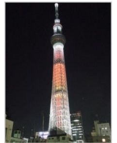
634mのクリスマスキャンドル

僕の中では毎年恒例となりつつあるクリスマス・イルミネーションめぐり。2013 年はスカイツリーへ行ってきました。スカイツリーのイルミネーションはさまざまな色の光を楽しむのではなく、黄色や白の明滅を楽しむもの。この時期は特別なクリスマスバージョンということでスカイツリーは大混雑！ 本当は展望台からの夜景も楽しみたかったのですが……。ということで、今回はツリーふもとのショッピングモール「ソラマチ」をぶらり。連なるお店には「東京名物」はもちろん、「栃木名産」に「京都銘茶」などなど、全国の名産品がもりだくさん。自分がどこにいるのか分からなくなりました(笑)。最後にクリスマス限定の和スイーツを堪能。2014 年もいい年でありますように……。 (岸)