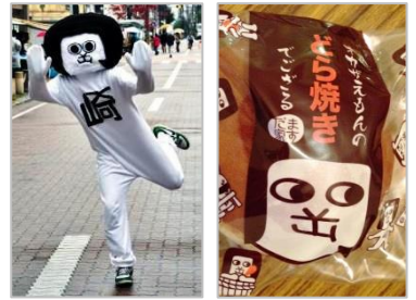
イラストになるとかわいいオカザえもん

実家に帰省すると、もらい物のお菓子がリビングに大量に置いてありました。その中に置いてあったのが「オカザえもんどら焼き」 義姉が地元で買ってきてくれました。オカザえもんは岡崎市出身の最近注目されている「ゆるキャラ」です。現代アート作家がデザインしたキャラクターらしいのですが、TV で見る着ぐるみの姿は他のゆるキャラのようなかわいさがありません。むしろ、少しきもちわるいからこそ好感を持つのもかもしれません。実家では、ふなっしー派の姪っ子とオカザえもん派の甥っ子で対立していました。(奥)