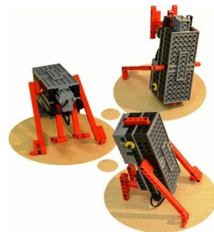
自らが回転して進んでいくクルリン

何を隠そう、私自身も子どもの頃はブロックが大好きで、飛行機、恐竜、お城、はては合体ロボットまで、毎日毎日飽きることなくブロックを組んで遊んでいました。今思うと、本当にたくさんのことをブロックを通して学んでいたことに気がきます。詳しいパンフレットや体験授業への参加をご希望の方は、お気軽にお電話ください。(菅野)