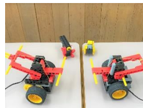
ベーシックコース： 「審判団も製作」