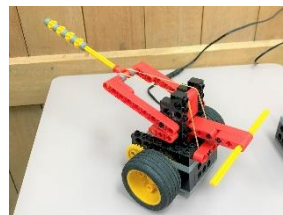
ベーシックコース： 「竹刀を可愛くアレンジ」

ミドルはロボバッテリーを製作。1回目の授業では完成後に投げる側と打つ側に分かれて遊べます。2回目ではタッチセンサーを使うことで投げた後に自動的に打ち返す仕組みに。そんな仕掛けがあったのかと驚きの展開でした。ミドルコースの生徒が増えてきました。今月は5名が進級。より複雑なロボット製作にチャレンジしましょう！（池田）