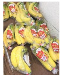
完熟王はいろんなスーパーで見かけます。

先月、1週間ほど体調をくずしてしまいました。胃腸が弱っていたのか、食べ物をあまり受け付けられない感じだったので、食事はウイダーinゼリーかバナナばかり。健康に気を使わないとダメだなと苦しみながら思い、ジムに通うこと、果物を摂ることをはじめようと決めました。スーパーに行き果物コーナーでいろいろな種類の果物っては、ミキサーでジュースにして飲んでいました。特にお気に入りのはバナナ。バナナにも品種がたくさんあるので、いろいろ試し中です。この前買った「完熟王」というバナナは糖度がとても高く粘り気があり、ミルクと氷、はちみつをまぜたジュースを作ったところ、さすが「完熟王」という味に仕上がりました。(奥)