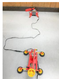
ミドルコース： 「三振か、ヒットか」