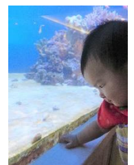
併設ホテルのおかげでベビー連れも安心。

連休を利用して八景島水族館に行ってきました。娘にとっては初めての水族館。泳ぎ回る青・赤・黄色の魚たちに興味津々なのですが、いかんせん素早い動きに目がついていけずムスッと不機嫌顔。それでもペンギンのよちよち歩く姿には身を乗り出して反応していました。水族館を選んだのはどうぶつ博士の妻で、エンペラー、トビ、マゼラン、フンボルト…数あるペンギンの種類を実物や写真を見る的確に当ててしまいます。「体長 60cm~70cm のペンギンって何？」とイジワルなクイズを出したら「それならアデリーペンギンじゃないかなあ？」と即答。理科の先生としてはかなりくやしかったです。(岸)