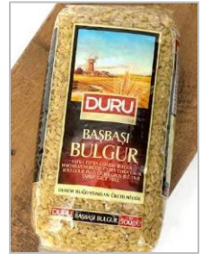
オリブオイルとの相性抜群！栄養価も高いです。

トルコでは国民食と言われるほどメジャーな食べ物で、お米に比べると歯ごたえがあり食べ応え十分です。炒めるだけでなく、サラダやドリアやリゾットにも使えるそうなので、色々試してみたいと思います。(奥)