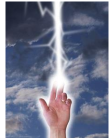
指先に静電気がはした瞬間 ※イメージです

これから毎年、冬のためにこの思いをするのかと思うとゾッとします。静電気多発症が今年限りであることを期待して、暖かい春を待つ今日この頃です。(山崎)