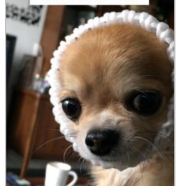
全ての出来事には意味がある。(アメリカのことわざ)