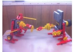
相撲に見えない(笑)