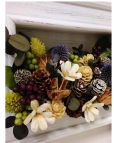
キレイで長持ち。もちろん水やりの手間いらず(笑)

「キレ〜!」受付にやってきた5歳ぐらいの女の子。ロボット教室に通う子の妹さんです。壁に飾られたドライフラワーを見て目を輝かせています。これはドライフラワーアレンジの専門店「ブローインハウス」さんの作品。僕はここのドライフラワーが好きで、これまでに何度注文したことか。わが家はもちろん、陽光のあちこちに飾ってあります。何年前には、京都にあるお店を訪ねたことも。清水五条駅から歩いて5分の町屋の中にあるブローインハウスさん。8畳ほどの店内には、見たことがない色とりどりのドライフラワーが所狭しと並んでいました。通販もやっていて壁掛けや置きものはもちろんのこと、素材を単品で買うこともできます。オーダーアレンジもプレゼントにピッタリです。(菅野)