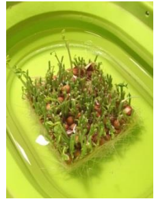
水に浸けて数日後。かなり伸びてきました。

普段はほとんど外食ですが、年に数回、料理をしようと思いつくことがあります。そんなに凝った料理をするわけではないですが、いろんな野菜を買ってきて、スープにしたりパスタにいれたりすることが多いです。今回スーパーの野菜コーナーで目についたのが豆苗。前回の料理ブームは数ヶ月前、そのときにはおそらく野菜コーナーで見かけなかった?と思います。家に帰って袋をよく見てみると「水につけておけば、2週間後にもう一度収穫して食べられます」の文字が。芽を切り取ったあとに残った豆と根を水につけておくと、2週間も待たずに元と同じほど生きてきました。食感も変わらずシャキシャキ。2度おいしい野菜でした。(奥)