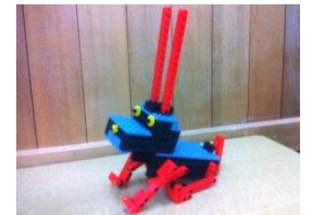
ロボワン「おすわり！」

回転するシャフトと尾びれをつなぐことで、体を左右に動かして進みます。また、前方に取り付けたピニオンギアが、ストッパーとして左右のタイヤを交互に動かす役割を果たします。