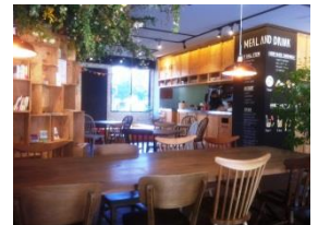
武蔵小杉駅北口から歩いて1分

武蔵小杉に素敵なお店を見つけました。地産地消や手造りが人気のコスギカフェです。伸び伸びと気持ちの良い空間。本を読んだり、パソコンを開いたりと思いつきに過ごすお客さんたち。キッズスペースも併設されていてベビーカーでも大丈夫。店長さんによると、地域の方が集まる場として街づくりプロジェクトの一環で運営しているそうです。子ども向けのワークショップやママ会の利用も多いとのこと。「ここで家庭学習の相談会を開いたらどうだろう……」とちょっと想像。最近が入塾相談とは別に、家庭学習のご相談を受ける機会も増えてきました。たくさんのお母さん方から聞いた子育てのお話と、長年の指導経験から勉強のヒントをお伝えする。感謝の気持ちを、地域の方々にお返しできたらうれしいですね。(池田)