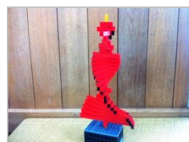
テーマ製作紹介： クリスマスツリー