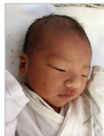
今のところは お母さん似

年が明けてすぐのこと、ついに父親になりました。元気な男子の子です。ところが、まだ会えていません。私がカゼをひいてしまったため、出産の立ち会いが禁止。熱が下がったので会いに行こうとしたら、今度は奥さんが発熱。母子ともに数日間は誰とも会えないそうです。う～ん、もどかしい。送られた写真を見て我慢しています。今は産休中ですが、奥さんは助産師をしています。赤ちゃんの世話や母乳のあげ方の指導などにも必要ないだろうということで、母子同室で二人だけの生活です。24時間、お母さんにべったりな息子。おじいちゃん、おばあちゃんにも会っていません。なんだか、お母さん大好きっ子になりそうで心配です。早く抱っこして、家族の一員に迎えたいと思います。(池田)