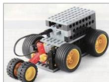
スーパービートル完成!