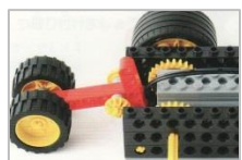
重要な角部分の取り付け