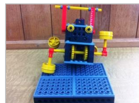
グングン登っていきます。