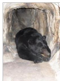
体温 34 度台は冬眠中のクマと一緒に。体重に続いて 2 つ目の共通点です。

食欲の秋も終わり、大好きなイチゴの季節である冬の到来です。食欲の秋の後遺症で、くちびるの端が荒れる症状がでてしまいました。しゃべるだけで口の両端がひび割れてしまいます。ご飯を口にするとまた割れる。笑うとさらにパカッと割れてしまいます。ヒリヒリしてなかなか辛いものです。笑ったときは予期せずいきなり痛みが走りますのでたまりません。最近やっと落ち着いてきました。先日、インフルエンザの予防接種を受けに行ったときに、先生に聞いたところほととけば直るとのこと、気長に待つことにしました。予防接種の際に病院で体温を測ったのですが、平熱が 34.8 度でした。ヒトは体温が 34 度になると仮死状態になると言われています。冷血人間である自分を再確認しました。(山崎)