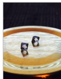
正八面体のミョウバン結晶。ちょっとずつ成長させます。

ミョウバン結晶を作りました。理科の授業で行う、水溶液の飽和実験の練習です。熱湯にミョウバンを溶かして飽和させた後、ゆっくり冷やしていくとミョウバンが再結晶化します。結晶をつけるために使うのは星やハートの形にしたモール。それをある程度の温度(約 60℃)になった飽和水溶液に浸して待ちます。練習では成功しましたが、本番では結晶のつき方に少しムラができてしまったとのこと。どうやら 8 人分のモールを浸すために大きめの容器を使ったのが原因のようです(※塾長談)。少量のモールを瓶で保存すれば、成功すると思います。楽しいのでご家庭では是非リベンジを！ちなみに、ちょっと難しいですがモールを使わないで正八面体の結晶を作ると、宝石のようでとても綺麗ですよ。(菅野美和)