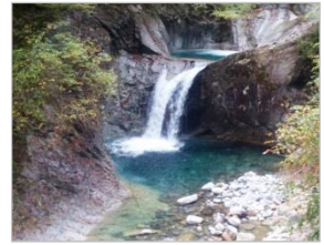
竜神の滝（日本の滝百選）@山梨

「突然旅」という言葉を聞いたことがありますか？まあ無いですよ。僕が考えた言葉ですから。「突然旅」とは前日や当日に「友達と〇〇に行こう！」と突然思い立つや、すぐさま旅に出ることです。計画は移動中の電車やバスで考えます。箱根、宇都宮、名古屋、一番遠いところで関ヶ原（岐阜県）まで「突然旅」をしてきました。旅のきっかけは高校の時から親しくしている友人から。「明日、〇〇行かない？」いい意味でテキトーな性格である彼からの誘いに当初は困惑しましたが、最近はこちらも軽く OK。困ったことに、これがなかなかおもしろいんです。先日も「突然旅」してきました。今回は山梨市。あまりにも突然すぎて電車の中で調べたハイキングコースが回れず、ぶどうにもほうとうにもありつけない無茶苦茶な旅でした。本当に仲の良い友達でなければ「突然旅」はおススメできません（笑）。（岸）