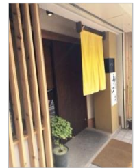
今なら新そばがいただけます

ときどき無性においしいそばが食べたくなります。そんなときは陽光から歩いて 2 分の「やぶ久（きゆう）」さんへ。このお店は、まず雰囲気がいいんですね。ちょっとモダンな照明にインテリア。それなのにおかみさんらしい女性をはじめ店員さんとはとてもフレンドリーであたたかい接客をしてくれます。もちろんそばもいいんです。少し細めでコシのあるそばを、濃いめのつゆでズツと。量が多く、大盛りになると食べきれないほどになりますが、お値段はひかえめ。ランチタイムは近くの会社勤めの人やママさんグループでいつも混み合っています。以前は満席で入れないこともあったのですが、今は拡張工事のおかげでゆったりとおいしいそばを食べられます。メニューを見ると、夜はおつまみ系のメニューが増えておいしいお酒も飲める店になるようです。休みの日にそば屋で一杯。日本酒好きの先生たちをさそって行ってみるつもりです。（菅野）