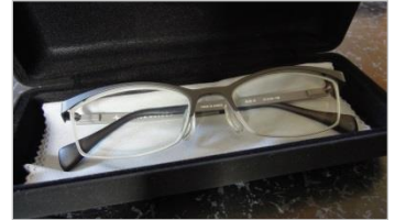
さよなら片頭痛—2013 岸モデル

「先生、メガネ変えた？」気づいてくれるとやっぱりうれしいですね～。僕がメガネを変えた理由はズバリ「片頭痛」。まぶしい光を見ると、目の奥からガンガン痛みがくるんです。この視覚刺激をどうにかしたい！そこで思いついたのがメガネの新調です。前から試してみたかったのが、パソコン画面などから出る光の刺激を抑えるという「PCレンズ」(店によって呼び方は変わりますが…)パソコンと向き合う時間も長いので、気になっていたんです。で、使い始めて1か月半が経ちました。結果は大満足！まず頭痛が起こる回数が減りました。さらに、起きたとしても以前ほどひどくなりません。どうやら乱視も進んでいたようで、元のメガネは左右のバランスが合っていなかったという事も頭痛の原因のひとつであったそう。同じ悩みをお持ちの方は視力検査をおすすめします！(岸)