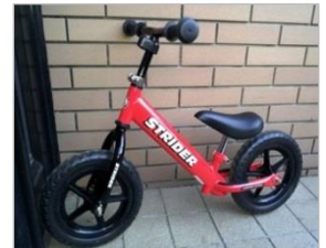
自転車の練習にもびったり！

甥っ子が2歳の時から乗っているストライダー。ペダルなし補助輪なしの二輪車です。両足で走るように地面をけて動かします。私が実家に帰ったときは、目の前の公園で大きなヘルメットをかぶって練習していました。そんな甥っ子が大会に出るというので応援へ。まず驚いたのは、参加する子どもの数が多いこと。2歳の部では15人で1レース、これを6レースも！さらに、参加者の力の入れようにもビックリです。チームTシャツを作って参加している人たち。BMXのハンドルやカラータイヤを取り付けた改造ストライダーにまたがっている子。そういった大会常連者は、レースもやっぱり速い！どうやらチームで定期練習をしているようです。甥っ子は見せ場もなく一回戦敗退……。次の大会に向けて猛練習です。(奥)