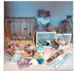
思いがこもった作品たち

新コーナー「簡単クッキング♪」の打ち合わせのため、プレーメン通りの先にあるイダカフェさんへ。陽光からだ歩いて10分ぐらいです。ちょっと早く着いたのでコーヒーを飲んでいると、何やら店内にある棚の前でごそごと作業している女性の姿が。じつはイダカフェさんはただのカフェではありません。料理イベントや教育資金セミナーを開いたり、レンタルシェルフ(棚)で手作り雑貨の販売を請け負ったりなどの活動もしています。さきほどの女性は、自分の作った雑貨をレンタルシェルフにディスプレイしているところでした。で、店員さんにこう言ったんです。「やっと夢が叶ったわ！」たった数十センチしかない、小さなスペースなんですよけれど、きっとこの女性にとっては持ちたくてしょうがなかった「夢のお店」なんです。自分の大切な商品につけるPOPの位置を、テープを片手にあてもないこうでもないと考えている後ろ姿はとても楽しそうでした。だれかの夢が叶う瞬間に立ち会えるなんて、とてもいい1日の始まりです。(菅野)