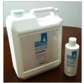
今年は例年以上に減りが早いです。

暑い、暑い夏の到来です。冬は寒がり、夏は暑がりの私にとって、この暑さはとても耐えられません。冬の寒さは服を重ね着すればなんとかかなりますが、夏の暑さは服をぬいてもまだ暑い！だからといって皮ふを脱ぐわけにもいきませんから困ったものです。そこで私の暑さ対策の必須アイテムが「シーブリーズ」です。これはアルコール成分のローションで、塗った瞬間から蒸発して身体から熱をうばってくれます。注射のときにぬる消毒のためのアルコールと同じような成分です。家では風呂上りに全身にぬります。さらに乾いたらぬるのくり返し。寝ていても、暑さで目が覚めたらまたぬります。ひと夏で1ガロン(=3.8L)の業務用タンクを毎年使いきっています。(山崎)