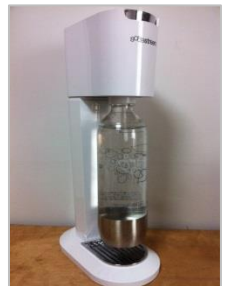
100%ジュースに炭酸も◎

夏は食事で乗りきろうと、毎年ゴーヤチャンプルーや生姜焼きを作っています。さらに今年は炭酸ガスの力も借りることにしました。炭酸ガスは胃腸を刺激するので食欲増進したり、体力回復の手助けになったりするのだとか。どこまで信じていいのか分かりませんが(笑)。もともと炭酸水が好きなので、夏バテ対策を理由にしてソーダメーカーを買ってしまおうと計画。水に炭酸ガスをプワットと入れるだけで炭酸水が簡単に作れるスグレ物です。調べたら、いろいろな製品が出ているようです。自分でポンペを買ってきて自作している人もいます。夏休みの自由研究みたいで楽しそうですが、タンクの迫力に怖くなりあきらめました。デザインもコストも良い製品を見つけ購入したのでシュワシュワ感を楽しんでます。(池田)